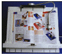
Der Turny Plus blättert vor- und rückwärts.

Der Turny Plus verfügt über eine Hilfsmittelnnummer und kann somit über die Krankenkasse abgerechnet werden.