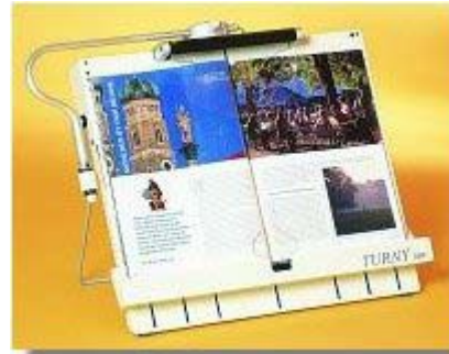
Turny Plus Basismodell