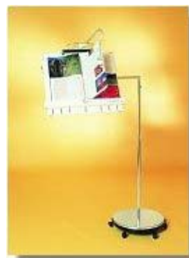
Modell Turny Plus mobil (Zubehör "mobil")